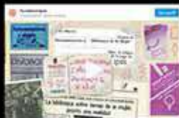
Motion graphics IPES 40 aniversario