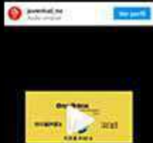
Motion graphics Juventud