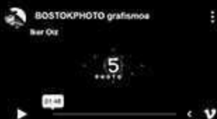
Diseño AV y animación BostokPhoto